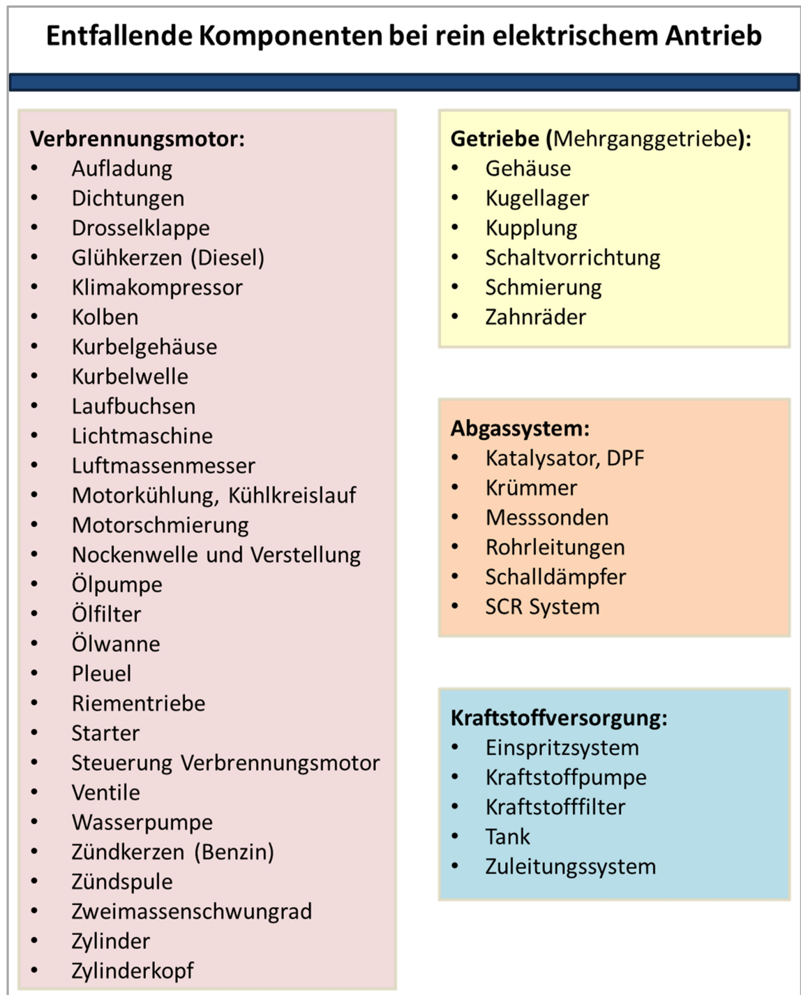
Abbildung 1: Entfallende Komponenten bei rein elektrischem Antrieb

Folgende Abbildung stellt die entfallenden Systeme und deren relevante Komponenten dar. (Teilsysteme und Komponenten alphabetisch angeordnet)